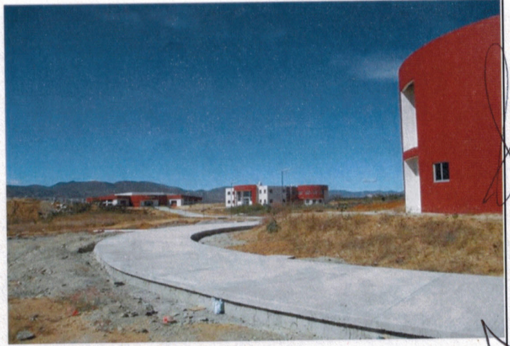
Andador posterior de Auditorio