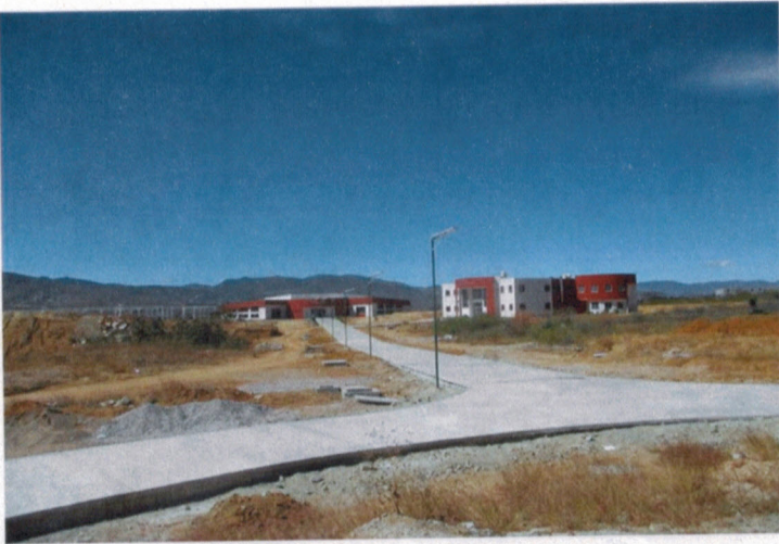
Andador hacia Laboratorio de Anatomía