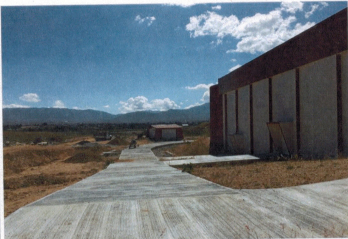
Andador lateral de Auditorio