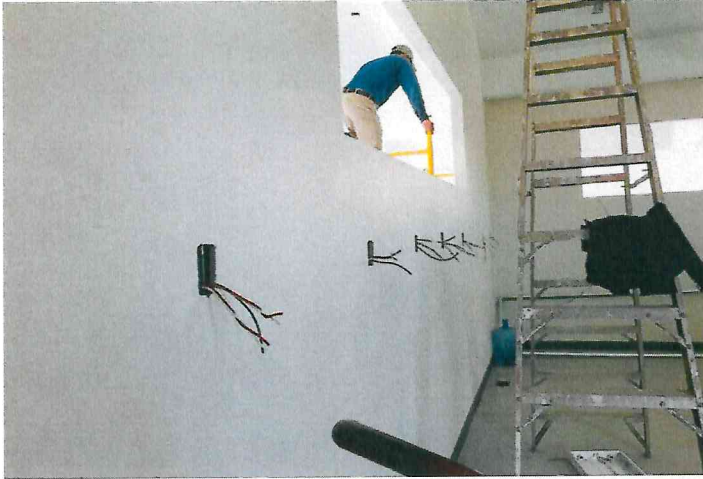
cableado de salidas electricas