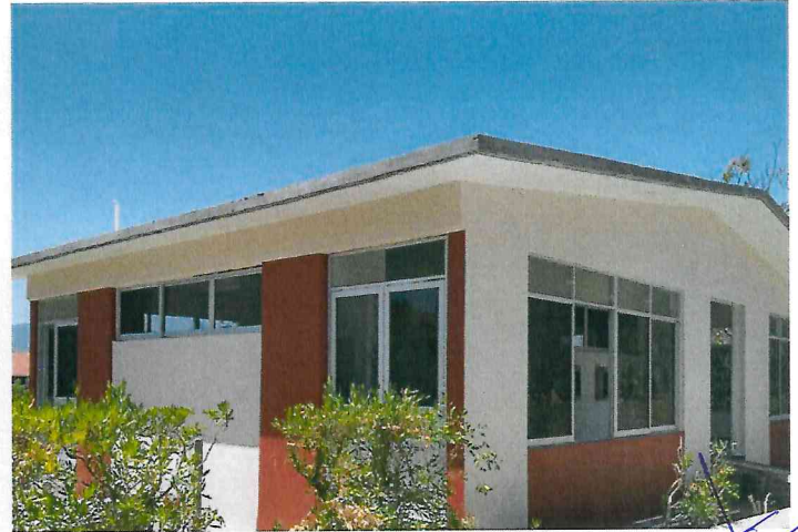
ventanas y puertas de aluminio