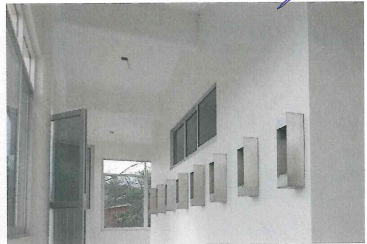
cableado de salidas electricas