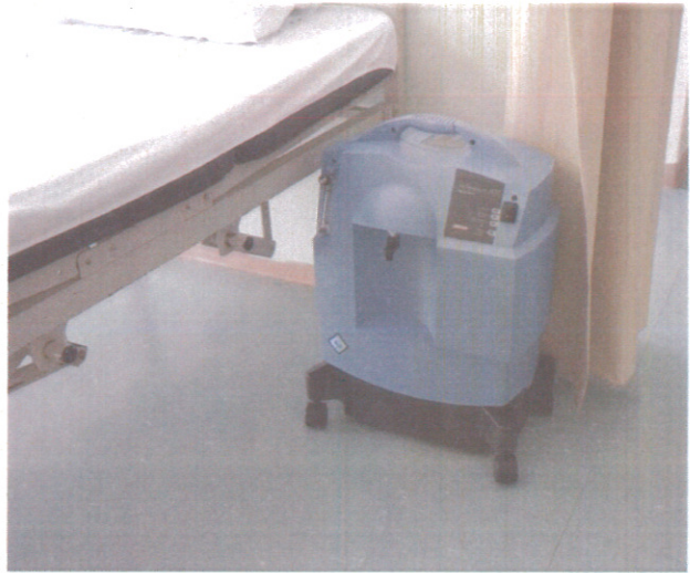
Equipo para fortalecer el proceso de enseñanza-aprendizaje