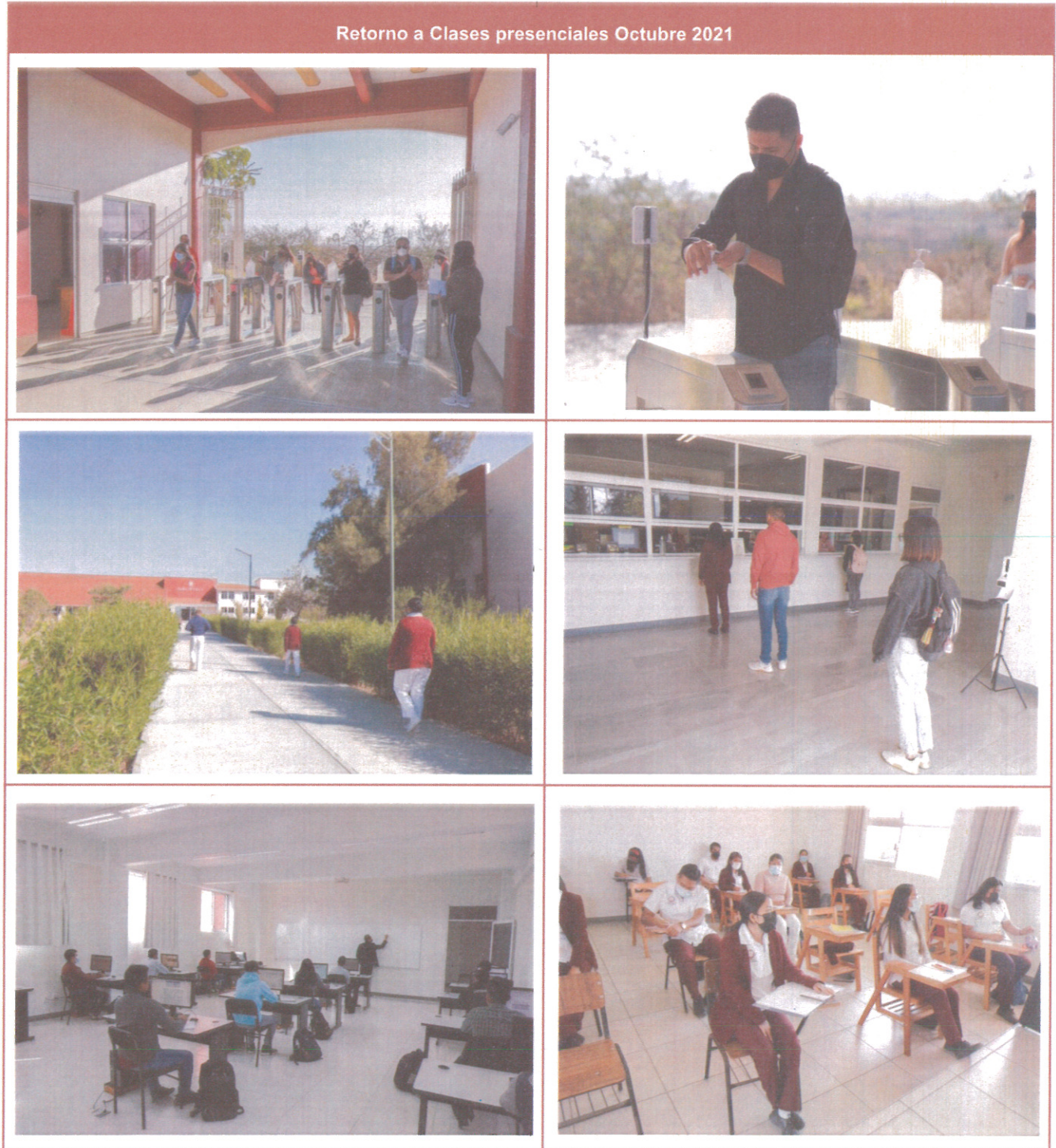
Tabla 4. Evidencia del retorno seguro a clases presenciales

Asimismo, en la tabla 4 se presenta la evidencia al retorno presencial de las clases presenciales, así como los equipos adquiridos e instalados en los espacios.