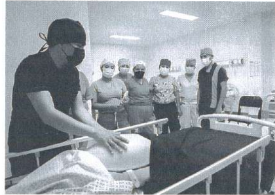
Fotografía 2. Profesores del CECyTEO capacitándose en el área de Labor de parto.