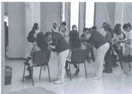
Fotografía 5 y 6. Alumnos vacunándose.