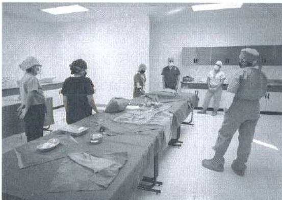
Fotografía 3. Profesores del CECyTEO capacitándose en el área de CEyE.