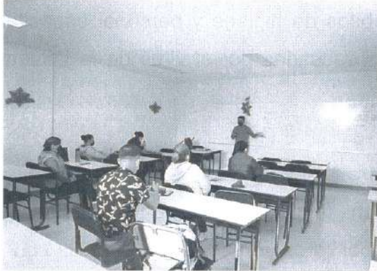
Fotografía 1. Profesores del CECyTEO recibiendo inducción en el Hospital Robotizado.